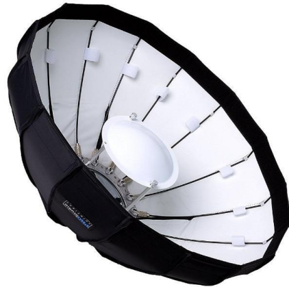
Beauty Dish Octagonal de 22"