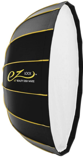
Beauty Dish de 42"